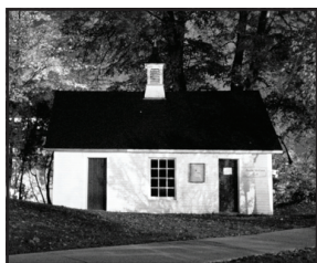
"Ice House" where writers have been meeting for over fifty years.

The University of New Brunswick's Creative Writing Program is one of the oldest and most prestigious in Canada.