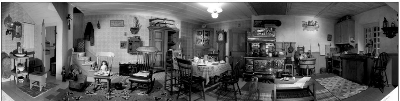
Fig. 1 La cuisine dans Mémoires .

Nous l'avons vu, l'exposition est un système comprenant une multitude d'éléments. Les reprenant en partie, chaque expert décline Mémoires sous certaines formes de façon à la faire entrer dans la catégorie patrimoine telle qu'ils la conçoivent. Dépassant notre cas, nous pouvons avancer que toutes les personnes interrogées