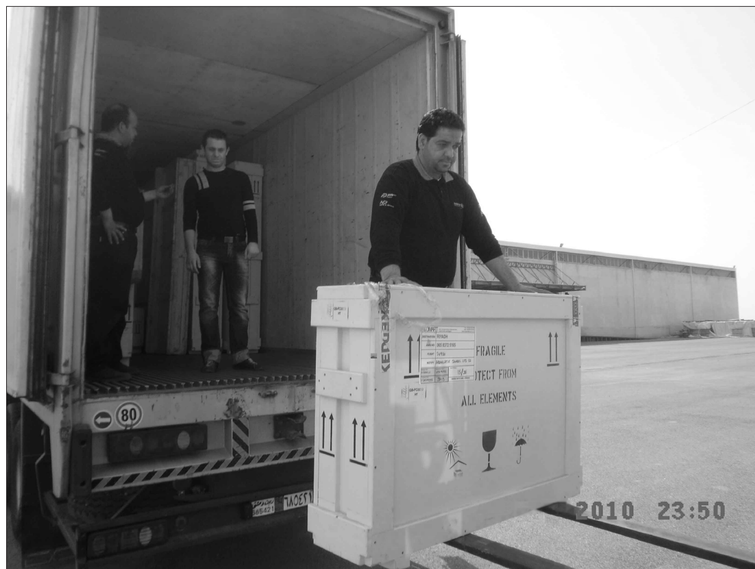
Fig. 2 Déchargement des caisses par des transporteurs locaux au musée national de Damas en Syrie.

L'omniprésence du coordinateur lors de l'itinérance et du montage des expositions à l'étranger est caractéristique de la régie d'exposition du V&A. À titre comparatif, la Tate Modern ne pratique pas la gestion rapprochée de l'itinérance mais transmet directement l'exposition au musée emprunteur pour qui les responsabilités et les marges de manœuvre sont donc plus grandes. Considérant que le V&A travaille avec de nouvelles institutions ou des lieux d'exposition moins conventionnels (à l'instar des écuries libanaises), le suivi et le contrôle des expositions en transit répondent à un devoir de précaution et permettent de garantir le respect