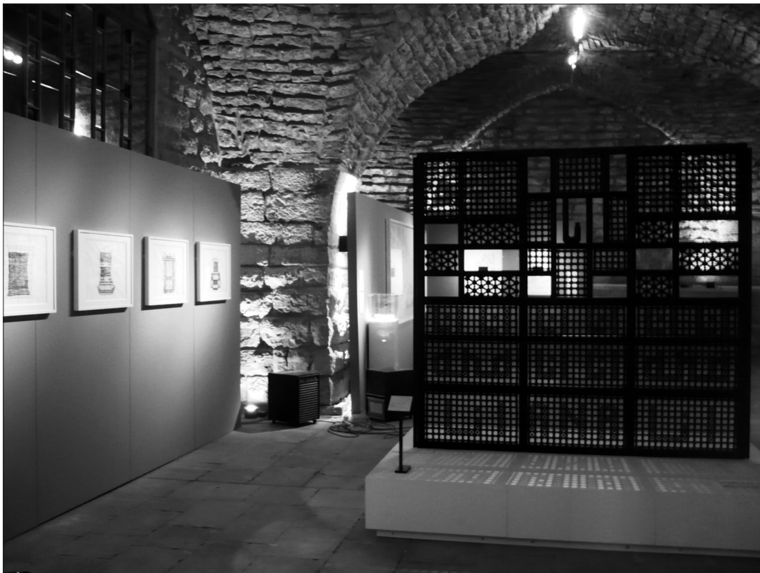
Fig. 1 Exposition du Jameel Prize du 26 juin au 13 août 2010 dans les anciennes écuries du Palais de Beiteddine au Liban.

Le Victoria and Albert Museum a pris le parti de coupler ces deux fonctions autour d'une seule figure professionnelle en vertu de la connaissance systémique du projet et de la position centrale qu'elle offre au régisseur dans le processus d'exposition. Entièrement mené par un professionnel de la régie, le projet est alors susceptible d'intégrer les préoccupations de préservation des œuvres à chacune de ses étapes, scénographie, budgétisation et planification incluses. La conservation préventive fait alors corps avec le projet et assure aux collections une prise en main optimale. A contrario , lorsque régie et gestion sont scindées, le régisseur d'exposition centré sur l'objet et sa préservation peut éprouver des difficultés à faire appliquer les normes de conservation face à des chefs de projet dont les logiques divergent. Si sa double casquette est atypique et bénéfique sur des expositions complexes, le coordinateur se distingue également par sa capacité à gérer l'itinérance des expositions.