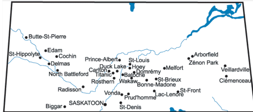
Figure 2 : Communautés francophones du nord de la Saskatchewan